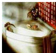
Salles de bain